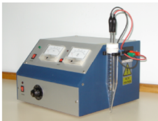
MODELO COMERCIAL DE-110-M3 SIN PROTECTOR.

En su versión actual de 3ª generación usa corriente rectificada media-onda. Tiene un sistema de seguridad que reduce el voltaje si la intensidad aumenta demasiado. Las salidas de voltaje e intensidad (VU metros) permiten monitorear el proceso. Permite predecir la capacidad deshidratante de una formulación en unos 15 mins.